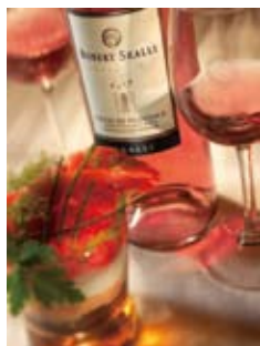
罗伯特斯格利梅洛红酒 (ROBERT SKALLI)