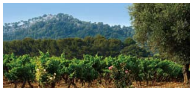
圣雷米德香薰植物种有机农业种植场一角

收获或者是机械收割的香薰植物，通过车辆立刻运往提炼工厂，放入提炼釜中提取精油等成份。又从现代切换到了早期的提取方法，介绍了香薰植物精油提取工艺的发展演变情况。