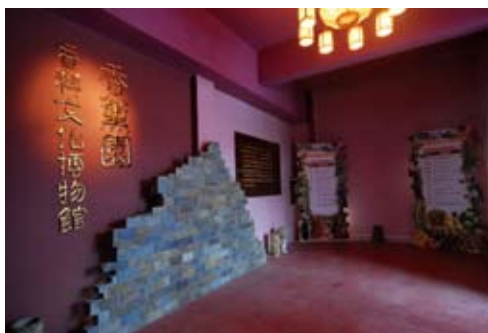
安和香薰文化博物馆

安和薰文化博物馆。表现了从遥远神秘的古埃及及尼罗河畔，到富丽堂皇的欧洲皇庭，从贯穿欧亚大陆的古代香料之路，到现回归自然的香薰疗法……安和的香薰文化博