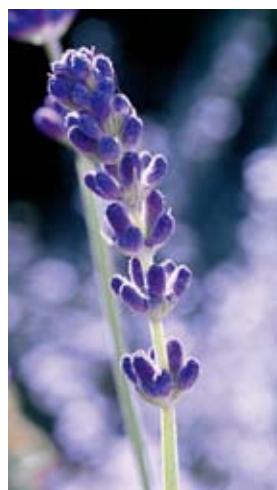
(纳宛达) 薰衣草花穗

LAVANDE) 为代表，来表述了有机农业种植的全过程。随后展示了野生花草植物的生长环境、与世界各地有合作的有机农场的种植概况。