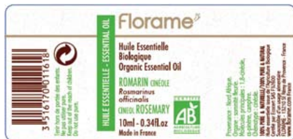
香薰精油产品身份证

在这个产品ID卡上，有一个特殊的条码编号，从香薰植物播种开始记录并贯穿始终，令我们可以找到该瓶精油的植株生长在什么地方、经历了什么样栽种的过程，随后在什么时候的批次采摘或收割，在哪里的何批次用什么工艺提取了精油，再在什么条件下生产出了什么批次的成品，成了现在这个样子。