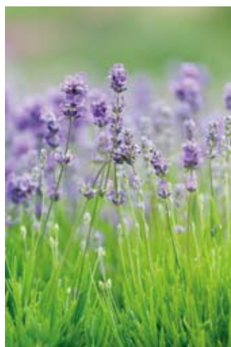
纳宛达薰衣草 (FLEURS DE LAVANDE)