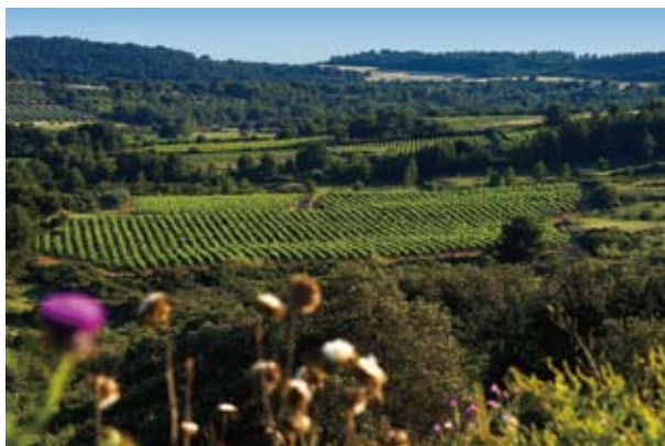
圣雷米德香薰植物种植业