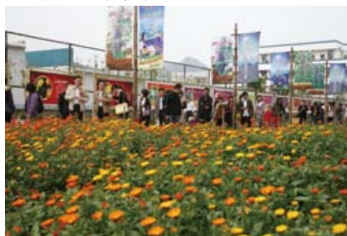
安和香薰博物馆: 香草大道