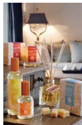
室内有机芳香系列产品