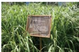
安和香草园的香茅