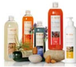
法恩香薰淋浴类产品